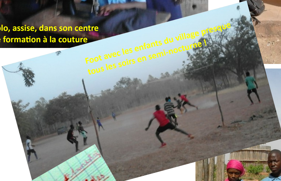
Foot avec les enfants du village presque tous les soirs en semi-nocturne !