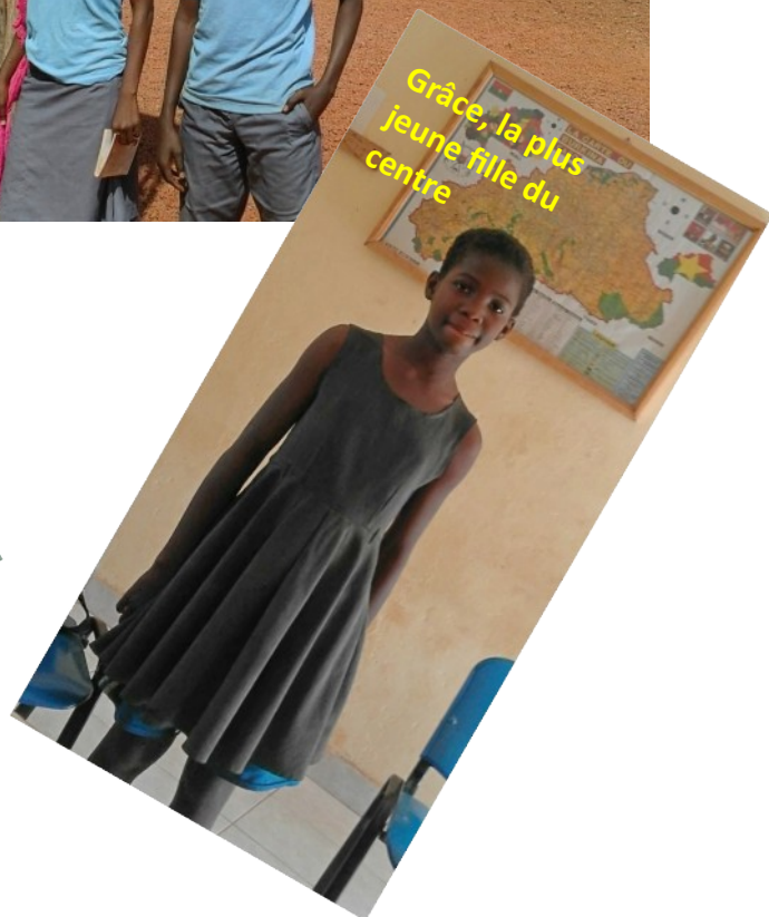
Grâce, la plus jeune fille du centre