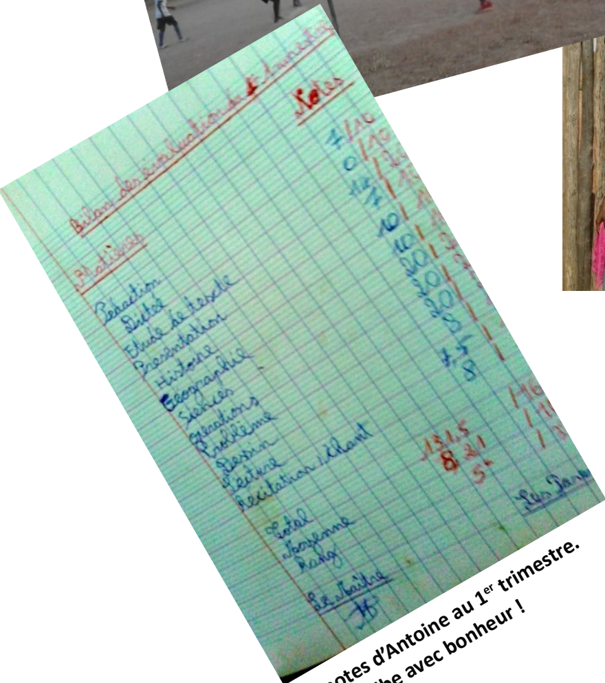
Les notes d'Antoine au 1 er trimestre. Il les exhibe avec bonheur !