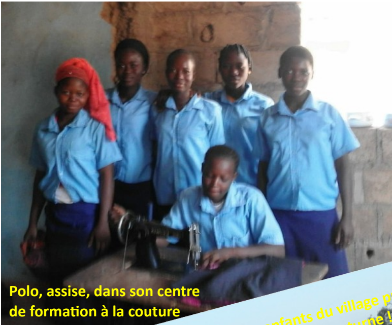
Polo, assise, dans son centre de formation à la couture